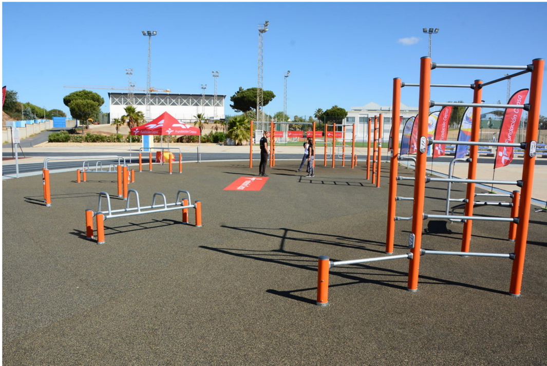
Circuit de calistenia de Palos de La Frontera